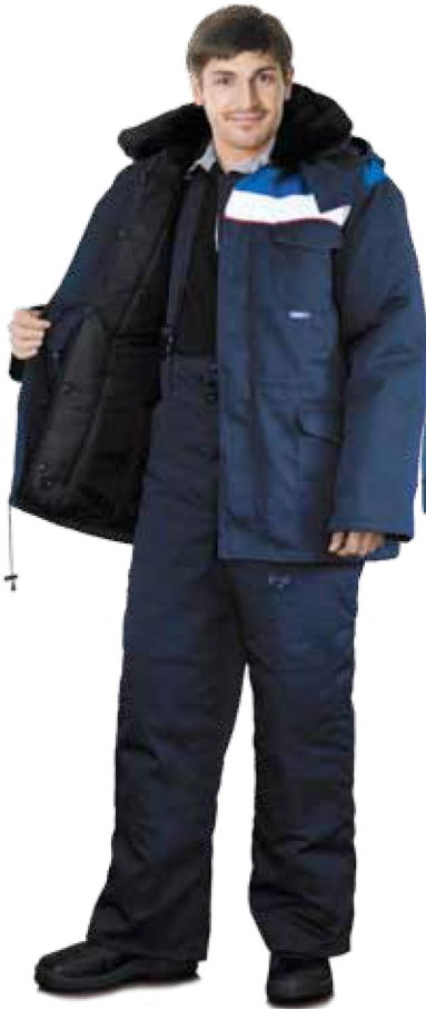
11820 тёмно-синий с васильковым

Одежда со специальными защитными свойствами