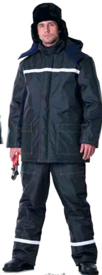
11105 чёрный с тёмно-синим