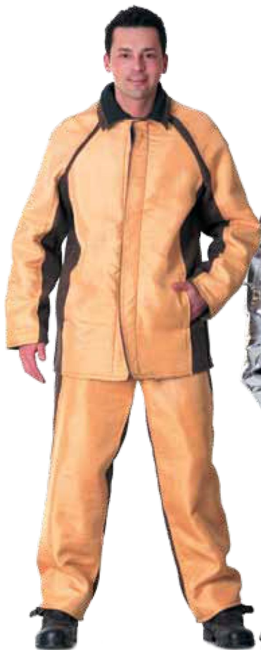
11109 серый с жёлтым

Одежда со специальными защитными свойствами