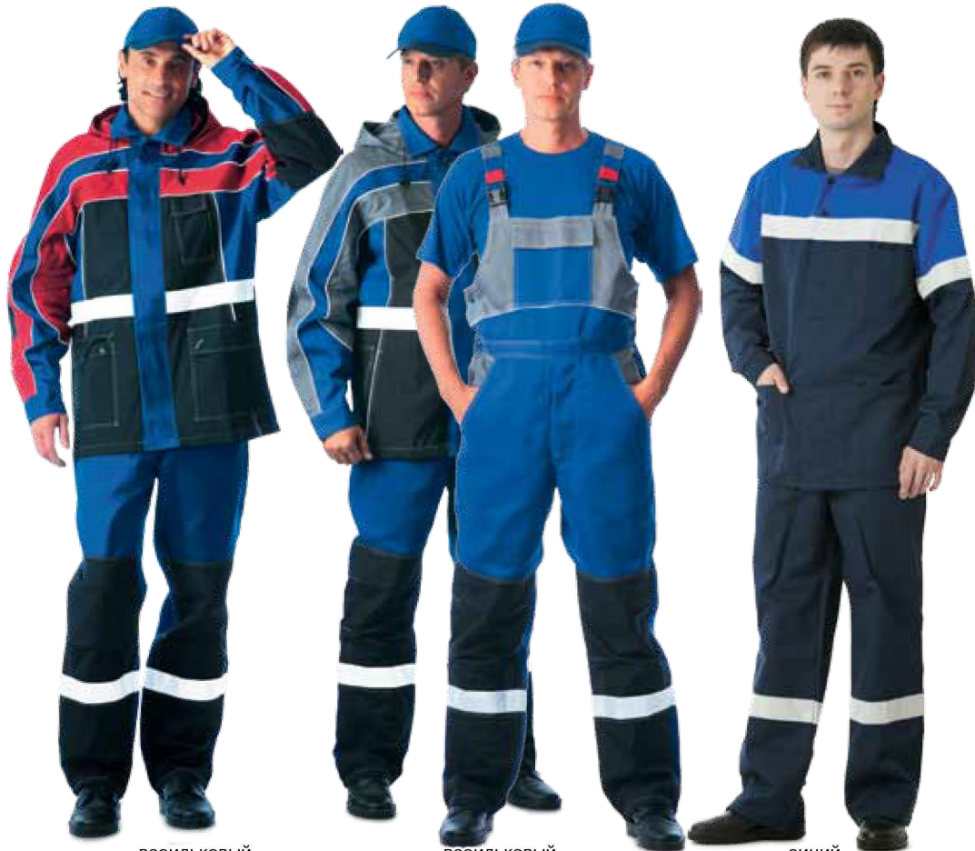
10246 васильковый с красным и чёрным