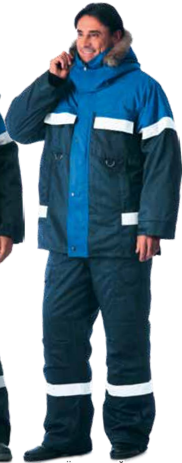
10283 тёмно-синий с васильковым, с меховой опушкой