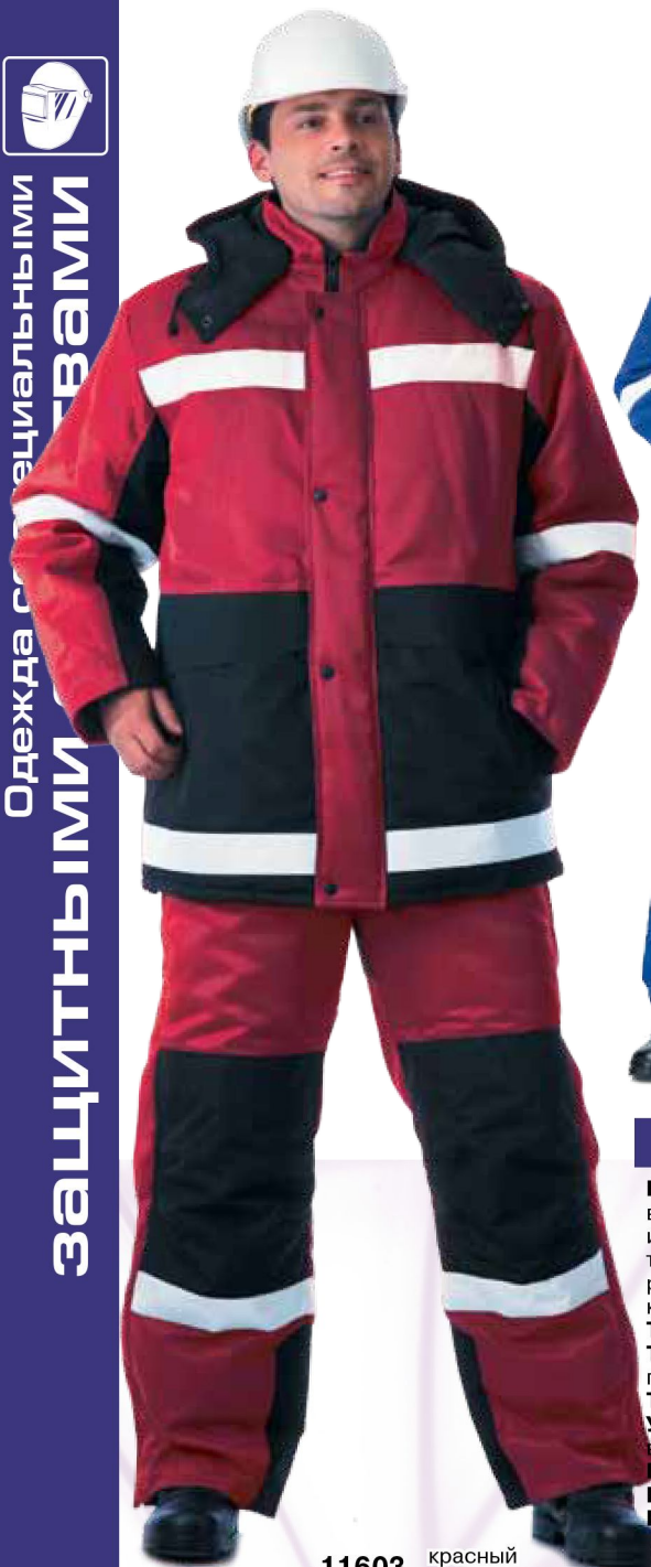
11603 красный с чёрным

Одежда с специальными защитными свойствами