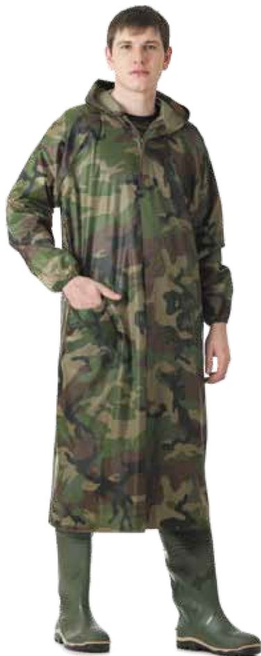
10730 КМФ зелёный

Цвета в ассортименте (синий, зелёный, красный, сиреневый)