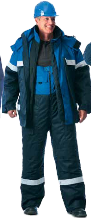
10285 тёмно-синий с васильковым