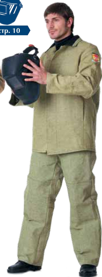
10317 с двойными накладками