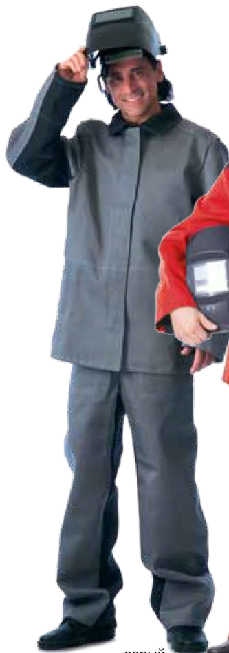
10270 серый с чёрным

Одежда со специальными защитными свойствами