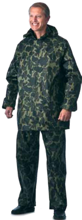
11117 КМФ «Лес»

Одежда со специальными защитными свойствами