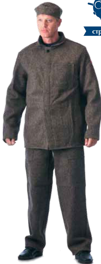
10888 чёрный 10764 серый