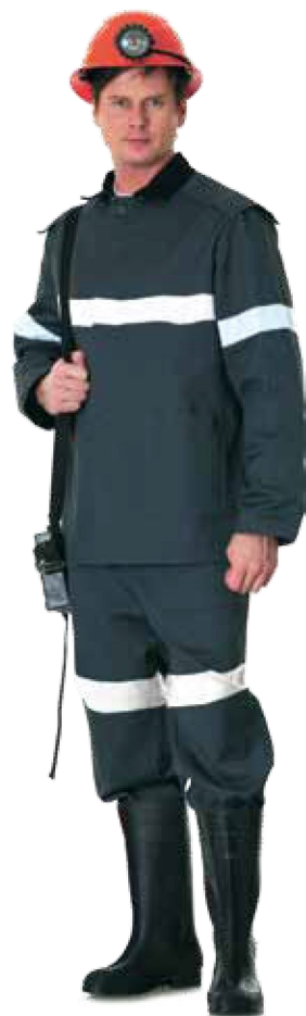
10759 серый с СОП