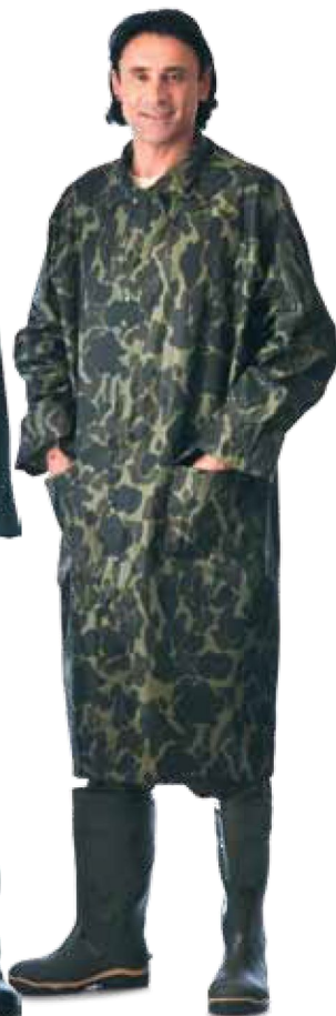
11118 КМФ «Лес»