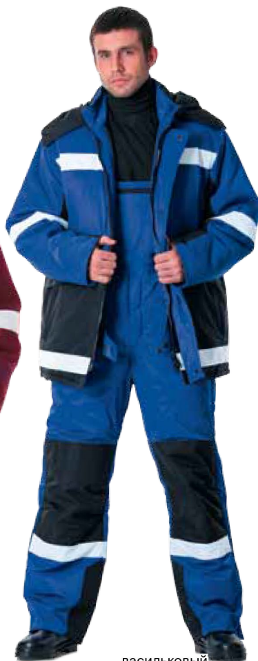
11103 васильковый с чёрным