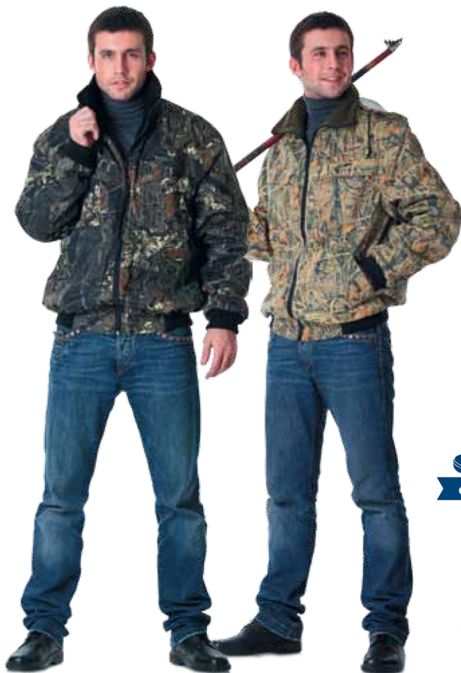
10349 КМФ «Мох»