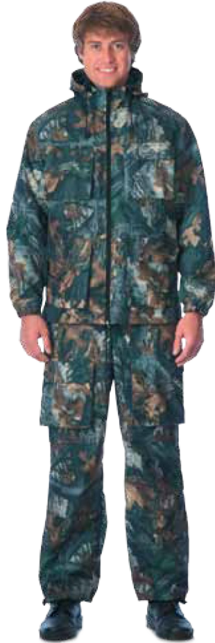
10783 КМФ «Серый лес»