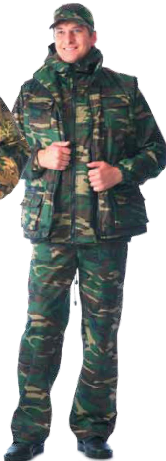
11181 КМФ «Лес»