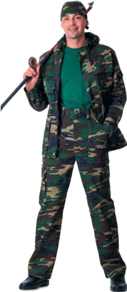
10358 куртка, КМФ «Лес»

камуфлированная одежда для ОХОТЫ и РЫБАЛКИ