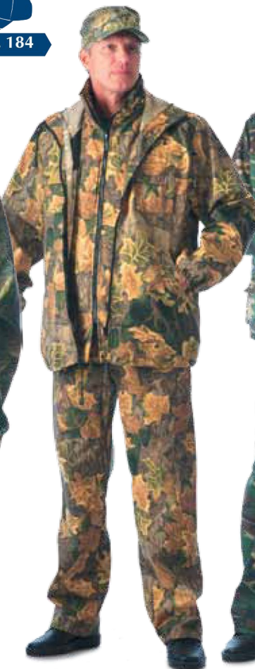
10237 КМФ «Дубок» жёлтый