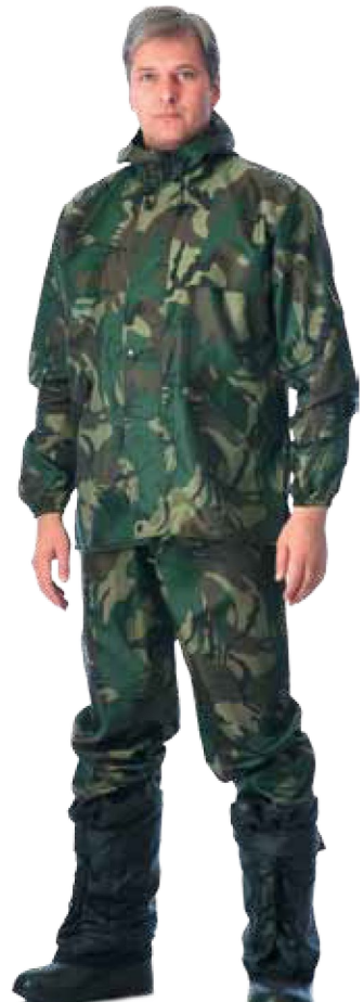
10287 КМФ «Лист»