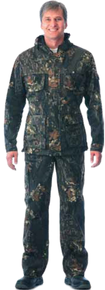
10272 КМФ «Лес»