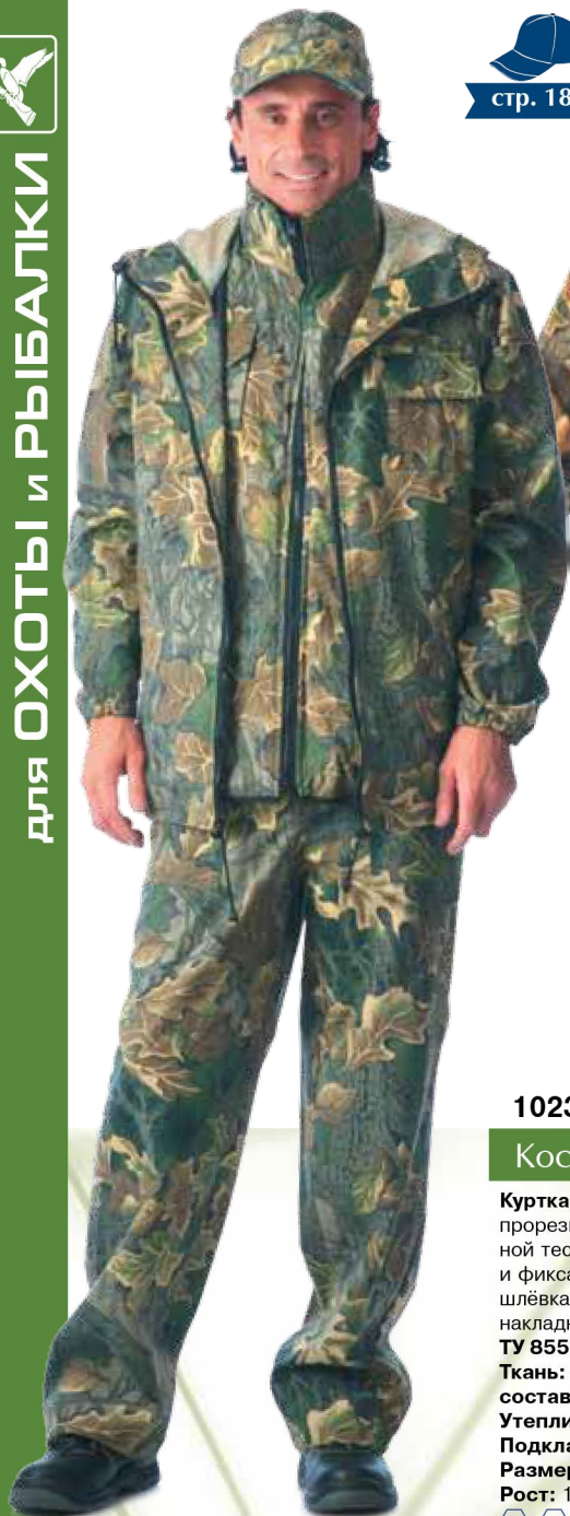
10238 КМФ «Дубок» зелёный